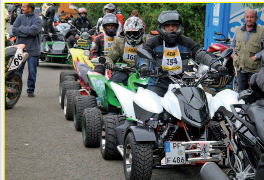
Bretten: Bikes, Quads und Gespanne am Start