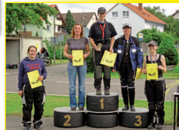
Siegerehrung: eigene Wertung für die Ladies